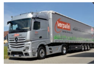
Zwölf „Mercedes-Benz Actros“ gehören zum Verpa-Fuhrpark

Seit seiner Gründung 1979 hat sich das oberfränkische Familienunternehmen Verpa Folie mit Stammsitz in Weidhausen (Landkreis Coburg) als Innovationsführer für stärkere-duzierte und nachhaltige Folientechnologien etabliert. Zweigwerke gibt es in Gunzenhausen, Denkendorf und Wrocław (Polen). Die Unternehmensgruppe beschäftigt insgesamt 535 Mitarbeiter aus 21 Nationen, 220 davon in Weidhausen. 51 Azubis werden in acht Berufen ausgebildet.